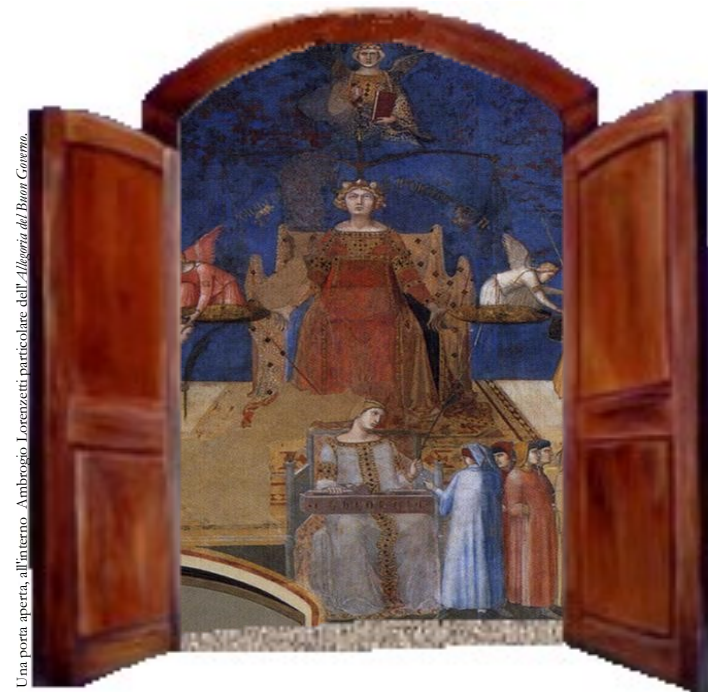
Una porta aperta, all'interno Ambrogio Lorenzetti particolare dell'Allegoria del Buon Governo.

Città giudiziaria, P.le Clodio Edificio A – aula Occorsio